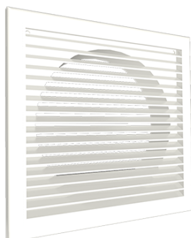
CM, CMP mřížka s pevnou žaluzií