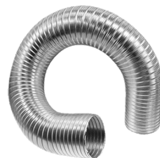
KLIMAFLEX ohebné hliníkové potrubí