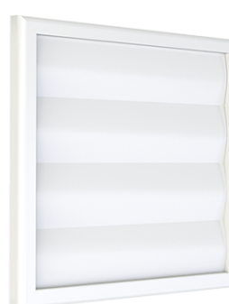
CM Z, CMP Z mřížka se samotížnou žaluzií