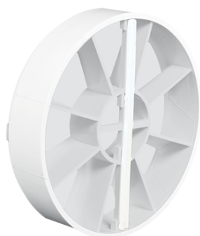
BDS zpětná klapka