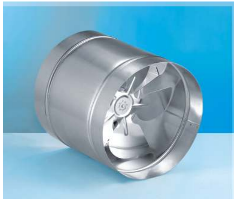
WB axiální ventilátor