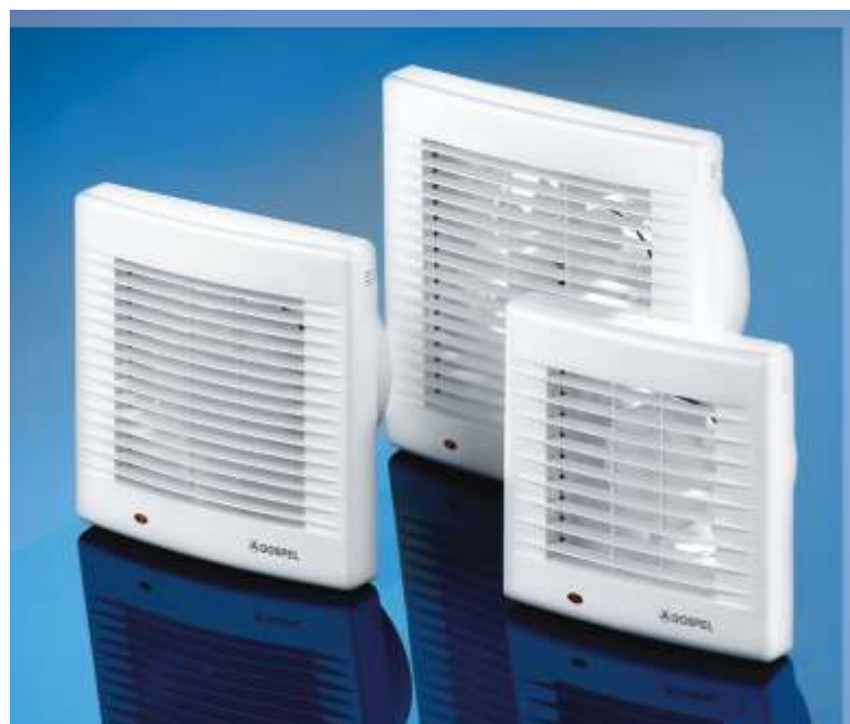
Axiální ventilátor POLO line