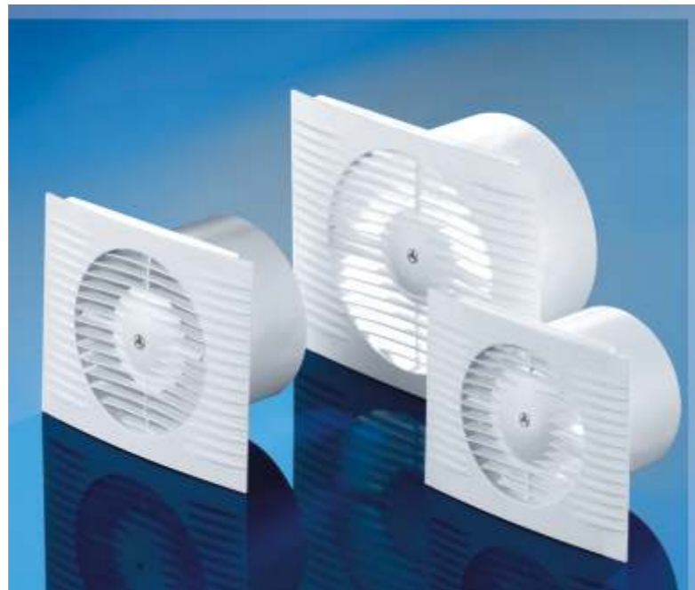
Axiální ventilátor STYL II line