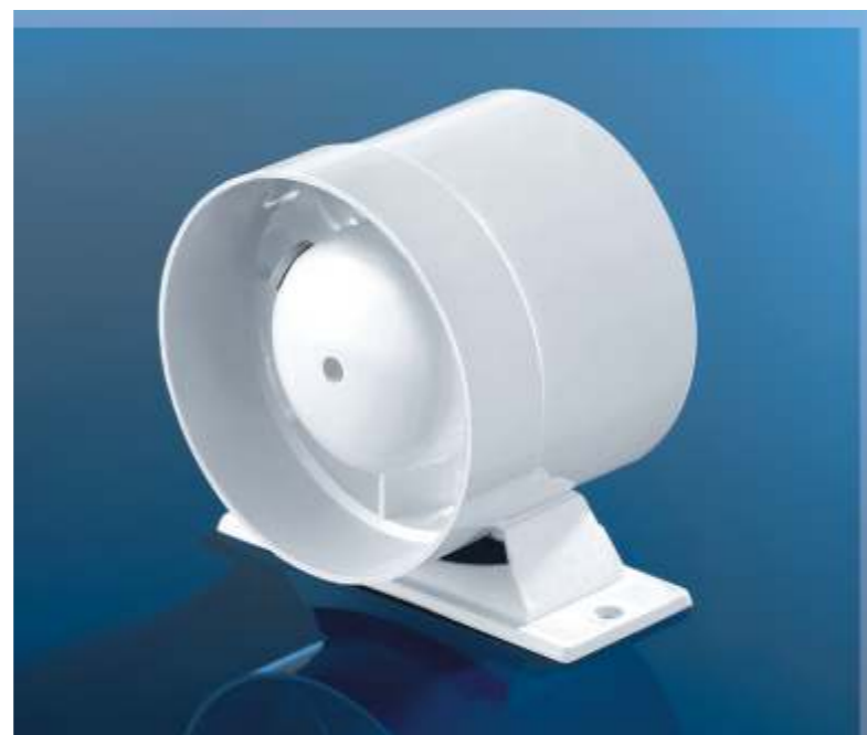
POLO axiální ventilátor

POLO 1 Ø100/104 N POLO 1 Ø100/104 W POLO 2 Ø125/129 W