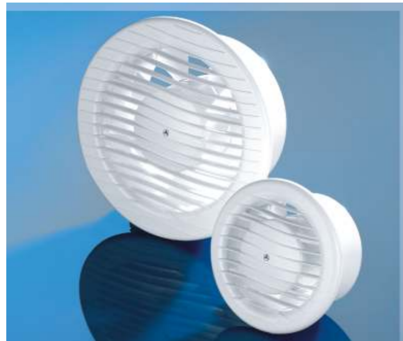
NV axiální stropní ventilátor