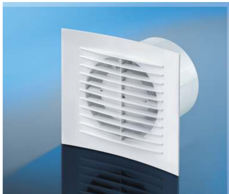
FRESH DOSPEL axiální ventilátor