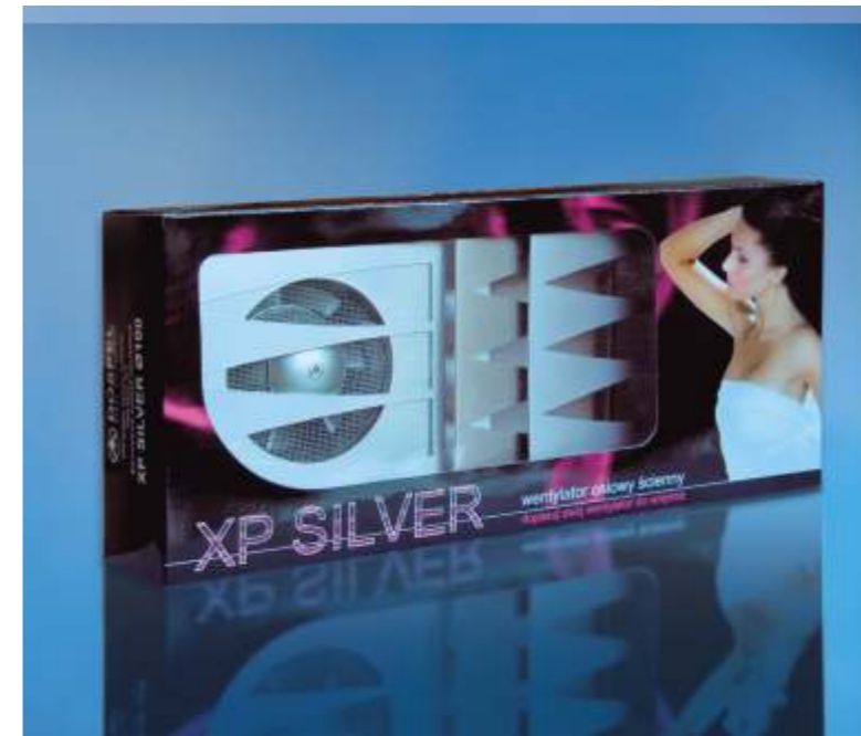
Axiální ventilátor XP SILVER line