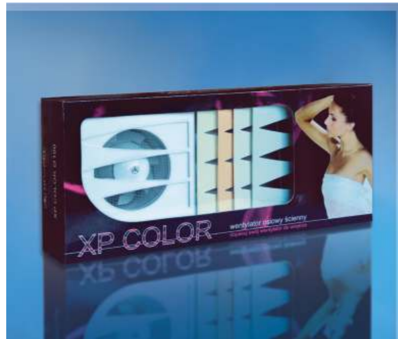
Axiální ventilátor XP COLOR line